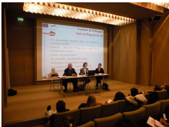
Table ronde 2 – la question migratoire en France et en Europe

Le projet européen Migrapass est un exemple concret de projet associatif pour faciliter l'intégration professionnelle des migrants. L'objectif principal est d'identifier et valoriser l'expérience et les compétences acquises par les migrants sur le marché du travail grâce à un portfolio et un accompagnement. Le Migrapass propose un approche holistique (professionnelle, sociale, personnelle) pour identifier une expérience, l'exprimer en termes de compétences, et pouvoir proposer un plan d'action vers l'emploi (formation, VAE, marché de l'emploi). Travailleurs sociaux, conseillers d'insertion sociale et professionnelle, et bénévoles des associations agissent comme tuteurs du portfolio. Ils aident les migrants à remplir le portfolio et exprimer leurs compétences. Le projet Migrapass valorise l'expérience de l'expatriation, qui est une méta-compétence, et les acquis non formels et informels. L'approche pédagogique, un portfolio et une formation collaborative dans une approche holistique de l'expérience est une innovation.